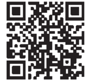
健保組合HP 「健康経営」