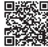
キューピーHP 「健康経営について」